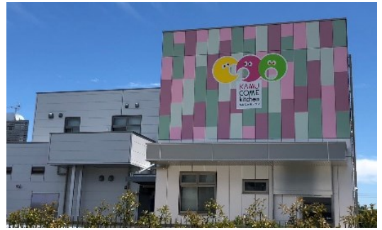
外観には可愛いイラストがあります