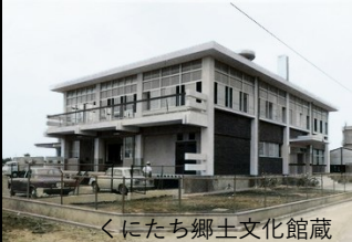
くにたち郷土文化館蔵