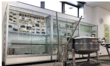
展示も栄養士さんたちの楽しい工夫がいっぱい！

8/17 開所メニュー 夏野菜カレー (やさいの日) 手作り！イカフライ 夏野菜サラダ こんにゃくのキラキラゼリー キャロットケーキ