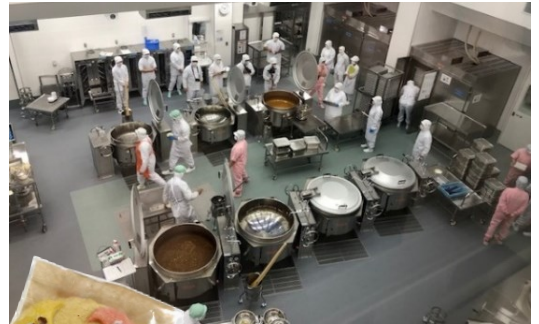
ドライフロアで清潔な調理場