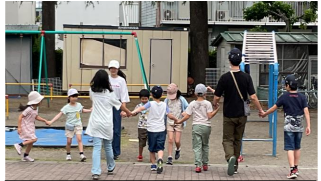
四友（たてわり班活動）での活動の様子

改めて日常生活を振り返り、一人一人の良さや頑張りを認め、褒め、価値付けられるよう教職員一同、取り組んでまいります。引き続き、本校の教育活動にご理解・ご協力をどうぞよろしく願いいたします。