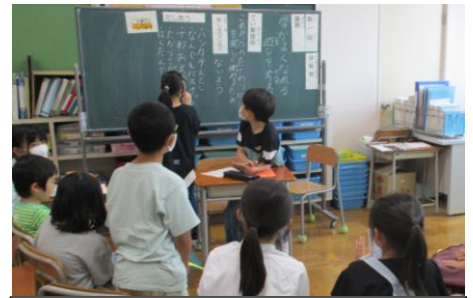
たてわり班での話し合い活動の様子

東京都では、いじめや不登校、暴力行為等の問題行動の未然防止や早期発見・早期対応等につながる具体的な取組を推進することを目的とし、6月と11月を「ふれあい月間」としています。本校でも、この期間に児童が不安や悩みを抱えたり、ストレスを感じたりした際に児童の心のサインに気付けるように、アンケートや学校の様子などを通じて素早く情報をキャッチし、「身近にいる信頼できる大人に相談することの大切さ」について、機会を捉えて全ての児童に伝えてまいります。児童から相談された際の対応が重要になってきますので、以前、ある講演会で子供たちから相談を受けた時の大人の関わり方についてのお話を紹介させていただきます。まずは、子供たちの心を支える大人の心構えとしては、「子供の悩みの専門家は子供自身である。」という視点に立って、曖昧さ、迷い、揺れが共存している中で、対話や質問を通して子供の考えを整理してあげることが大切だということでした。その際、相談者への具体的な言葉かけについてもご教示いただきました。