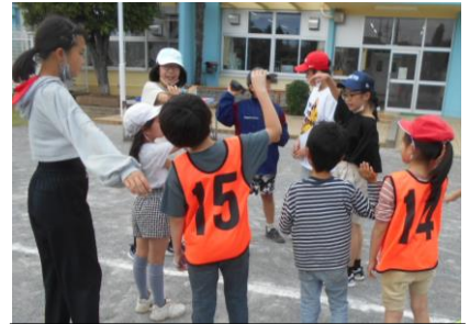
たてわり班活動での遊びの様子

毎週木曜日、給食の後の時間での活動を原則とし、会議（話し合い活動）やそこで決まったことを基にした交流活動を行っています。