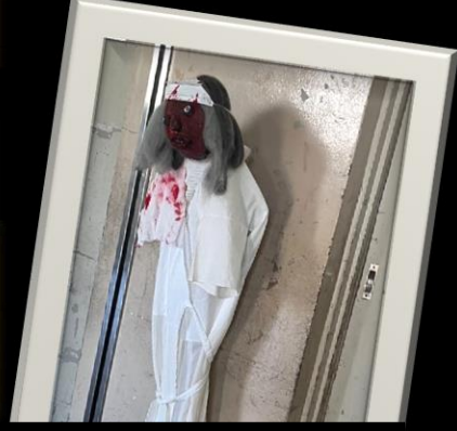
怖〜い受付嬢がお出迎え