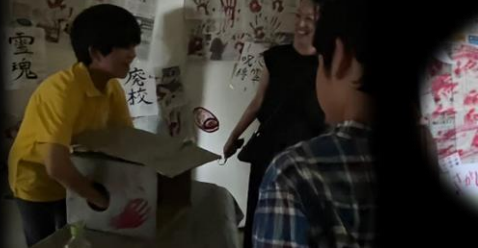
ミニゲームも充実