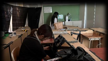
保護者もみんな気合十分！