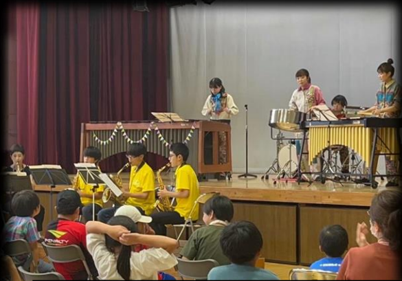
スタート！大盛り上がりの演奏会