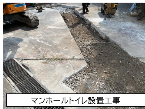
マンホールトイレ設置工事