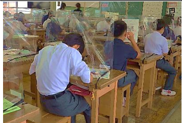
机上に飛沫防止透明ガードを立て授業に臨んでいます。