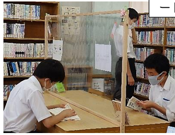
部活動も始まりました