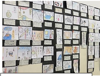
臨時休業中の美術の課題が展示されています。