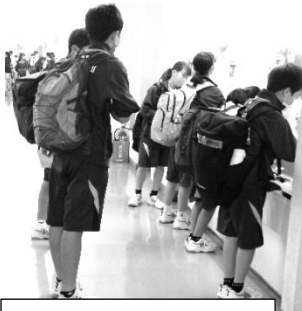
教室に入る前に手を洗います。