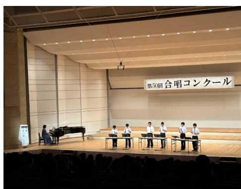
A組 トーンチャイムによる演奏