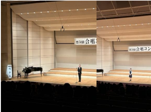
閉会式（校長・実行委員長あいさつ）